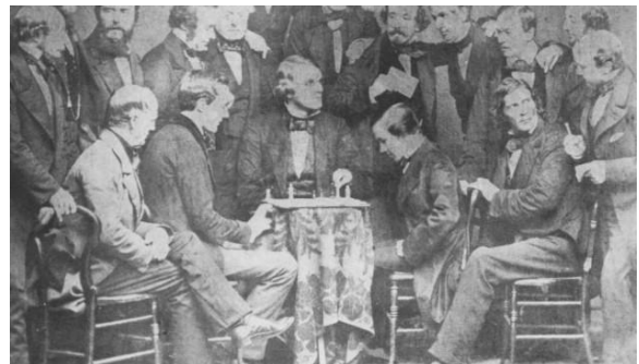
De match Morphy-Paulsen.

Want in die tijd hadden de schakers geen last van tijdnood; schaakklokken die de bedenktijd mooi in partjes sneden en bijhielden, ze waren er niet! Men mocht nadenken zo lang men wilde. En daarvan werd vaak uitbundig gebruik gemaakt. Een mooi, hoewel apocrief verhaal in dit verband, vertelt over de match in 1857 tussen Louis Paulsen en Paul Morphy. Paulsen was een zo'n beruchte langdenker. Tijdens een van hun partijen had Paulsen na zo'n twee uur nog steeds geen zet gedaan. Morphy werd het er begrijpelijkerwijs te veel aan en vroeg hem of het niet eens tijd werd om te zetten. Paulsen keek hem ontsteld aan en stamelde: "Ben ik werkelijk aan zet?" Spoedig daarna stopte het genie Morphy met schaken.