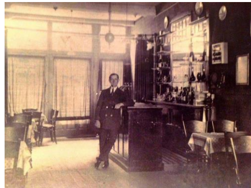
In de 'Gouden Tijger'. Ong. 1930

Later dat jaar, op 30 juni 1945 op een algemene vergadering van de LISB, stelt de VSV vast hoe men de oorlog was doorgekomen: "geen doden, alle materiaal verloren!" Vooral het verlies van de schaakklokken trekt een zware wissel op het spelen van partijen. Daarover later meer.