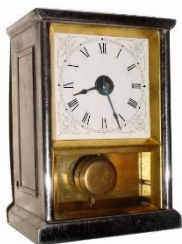
De Yale Clock New Haven Chess Timer.

Zo te zien is het trouwens maar goed dat de huidige privacy regels nog niet in zwang waren. Goedkeurend applaus door de 'Kiebitze' 1 bij een mooie of afkeurend geknorrepot na een slechte zet, was schering en inslag! Dit kon zo natuurlijk niet doorgaan. Er werd achtereenvolgens met zandlopers en stopklokken gewerkt totdat in 1870 bij het grote internationale toernooi van Baden Baden er met een heuse schaakklok werd gespeeld. Speeltempo 20 zetten per uur. Een hele vooruitgang.