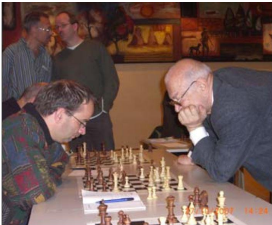
Viktor tijdens de simultaan van DJZ