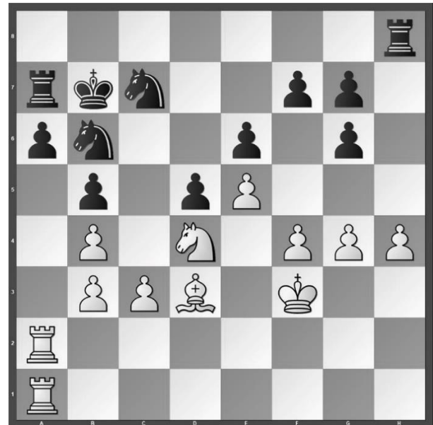
Diagram na 49... Th8

But in upcoming time trouble I missed it with