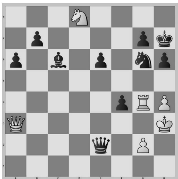
Diagram, na zet 38...Pg6

Wit heeft zijn kan gemist op remise en de koning van wit wordt een aanvaldoel voor mijn dame en paard. Daarna win ik met een mooie en lange combinatie.