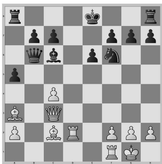
Stelling na zet 16. Lc2

1.e4 e6 2.d4 d5 3.Pc3 Pc6 4.Pf3 Pf6 5.Ld3 Lb4 6.0-0 Lxc3 7.exd5 Lxb2 8.Lxb2 Dxd5 9.c4 Dd6 10.Db3 a5 11.La3 Pxd4 12.Pxd4 Dxd4 13.Tad1 Db6 14.Dc3 Ld7 15.Td2 Lc6?! 16.Lc2