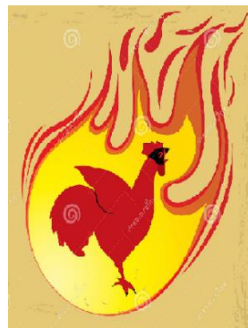
De Rode Haan: het dubbelsymbool

"Als de voorzitter de voorzittershamer niet had vergeten, had hij waarschijnlijk het schaken tijdens de vergadering kunnen teggengaan".