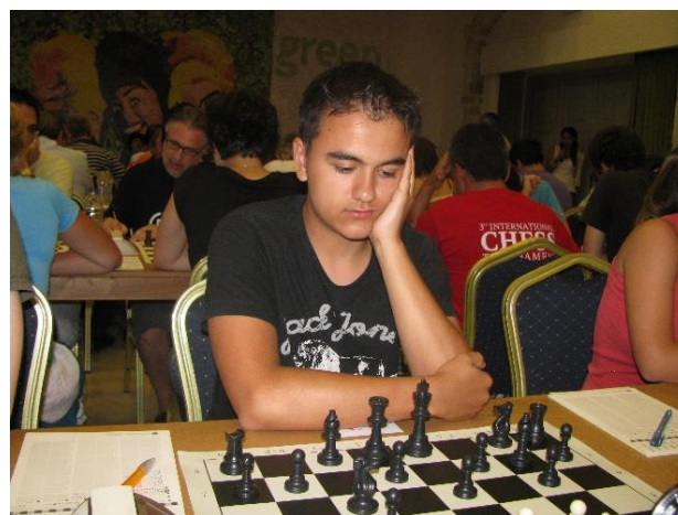
Foto uit het toernooi